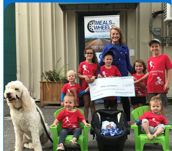
Photo: Meals on Wheels Home Delivery Program

United Way is working to provide everyone with access to enough nutritious, affordable, and appropriate food, from community gardens to school breakfast programs and food banks.