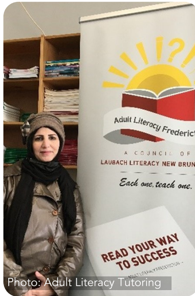
Photo: Adult Literacy Tutoring